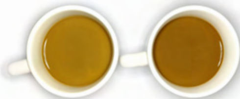
Lactorich Blis C4 Principal concurrent de FFMP