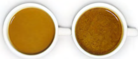
Lactorich Blis C4 Principal concurrent de FFMP

Il vous permet également d'obtenir un excellent effet blanchissant ainsi qu'une sensation onctueuse et veloutée en bouche dans le thé et le café, offrant ainsi à vos clients une expérience de dégustation incomparable.