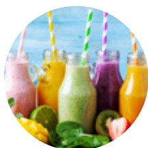
饮料 (即果味牛奶饮品)